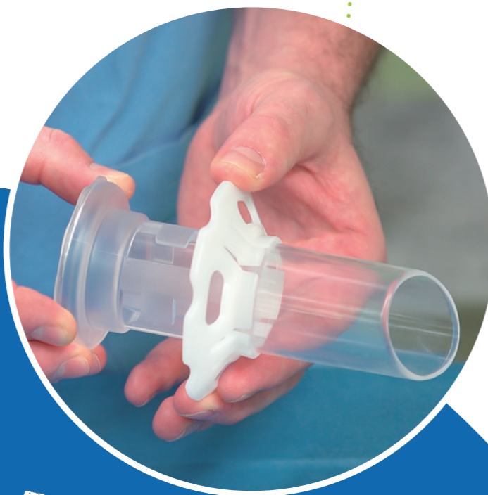
Ghiera di fissaggio, corsia di scorrimento Locking ring, sliding track

ARAMIS is a disposable surgical device dedicated to the transanal minimally invasive surgery of rectal pathologies such as polyps, T1 rectal cancers, anastomotic stenosis, complex fistulas.