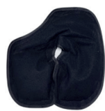
Pack de froid pour le sein droit