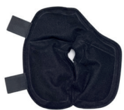
Pack de froid pour le sein gauche